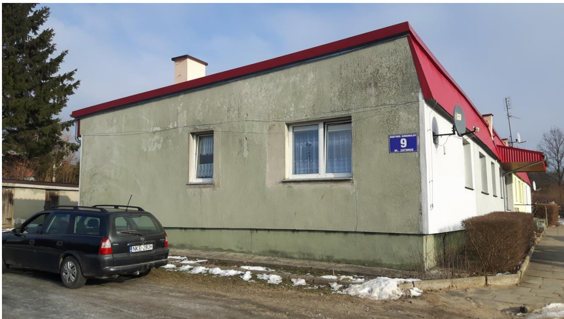
Fot.3. Kętrzyn, budynek mieszkalny ul. Zatorze 9 – elewacja boczna. Fot. J.Baran.