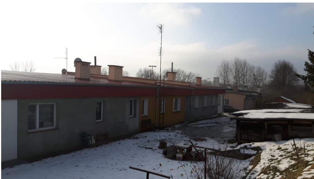
Fot.2. Kętrzyn, budynek mieszkalny ul. Zatorze 9 – elewacja tylna.