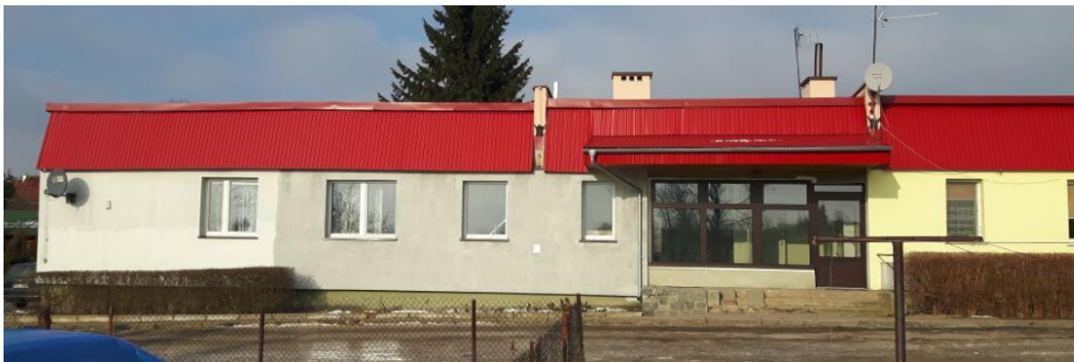
Fot.1. Kętrzyn, budynek mieszkalny ul. Zatorze 9– elewacja frontowa, stan obecny. Fot. J.Baran.

Budynek znajdujący się przy ul. Zatorze 9 charakteryzuje się wysokim stopniem zużycia elewacji w części tylnej i bocznej. Po dokonaniu oględzin stwierdzono liczne docieplenia budynku o różnych grubościach. Zły stan części okien. Konstrukcja dachu w stanie dobrym po remoncie, jego pokrycie po wymianie, odwodnienie liniowe dachu z blachy stalowej ocynkowanej zużyte, nie nadające się do użytku. Chałupniczo wykonane docieplenia budynku. Budynek kwalifikuje się do wykonania docieplenia.