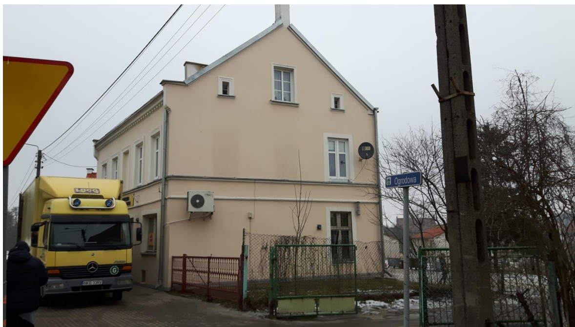
Fot.1. Kętrzyn, budynek mieszkalny ul. Ogrodowa 1 – elewacja frontowa i boczna, stan obecny.

Budynek znajdujący się przy ul. Ogrodowej 1 charakteryzuje się wysokim stopniem zużycia elewacji. Po dokonaniu oględzin stwierdzono liczne odspojenia i spękania tynku, odspojenia malatur na budynku. Zły stan części okien i drzwi zewnętrznych. Konstrukcja dachu w stanie dobrym, jego pokrycie po wymianie, odwodnienie liniowe dachu z blachy stalowej ocynkowanej po wymianie. Budynek kwalifikuje się do wykonania docieplenia.