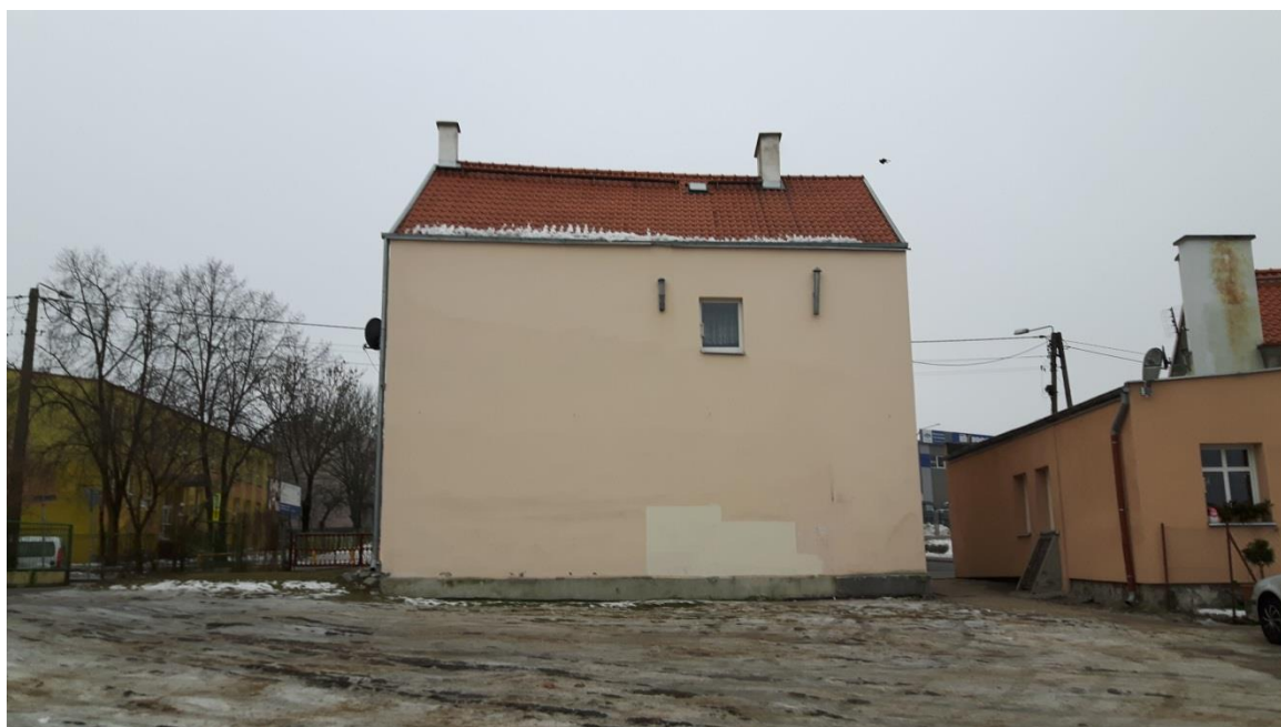
Fot.2. Kętrzyn, budynek mieszkalny ul. Ogrodowa 1 – elewacja tylna, stan obecny.