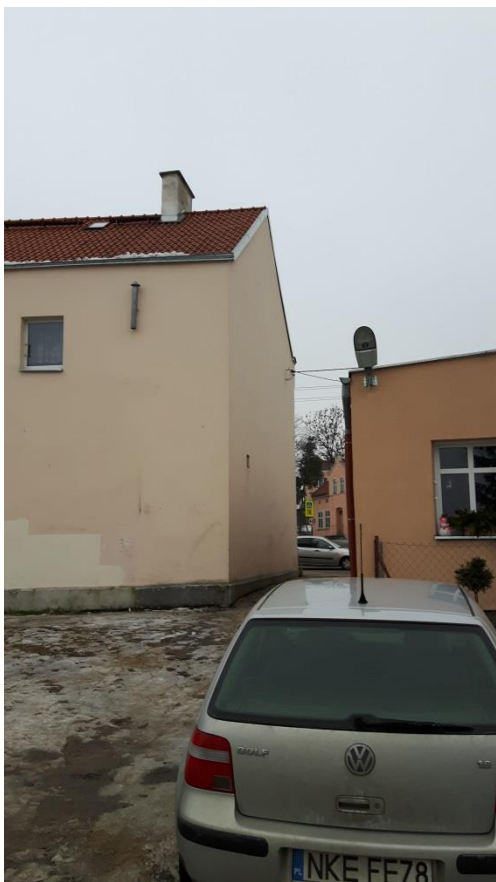
Fot.3. Kętrzyn, budynek mieszkalny ul. Ogrodowa 1 – elewacja tylna i boczna, stan obecny.